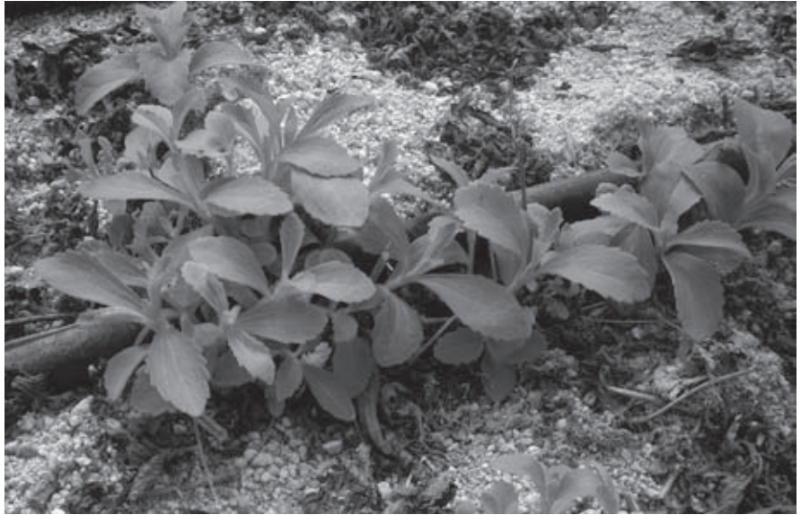
La Stevia rebaudiana es el mejor sustituto del azúcar. Ha permitido controlar la diabetes a muchas personas.

enfermedades graves o terminales con plantas o con terapias naturales. Siempre desde la experiencia personal; no se entienda que esto es una iniciativa más que pretende hacer negocio con plantas o terapias. Entendemos que la persona que se ha curado de este modo debe ser solidaria con el resto de personas, que deben conocer estas posibilidades. Si podemos conseguir centenares o miles de personas que públicamente digan, con su nombre y apellidos, su dirección y su correo “estoy aquí, para lo que haga falta”, no hará falta desplazarse a unos pocos puntos de la península para encontrar un testimonio, sino que cada persona interesada tendrá alguno cerca.