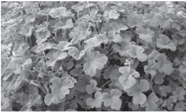
El geranio aromático Pelargonium tomentosum. Se le atribuyen propiedades antitumorales.

esta artemisa, porque no puede ser que los pobres de África y Asia se curen gratuitamente de la malaria con una plantita cultivada en casa. El remedio se lo tiene que proporcionar la bestia farmacéutica, y para ello la planta tiene que estar patentada. De modo que están a punto de conseguir, de hecho ya lo han conseguido, una molécula de artemisina, muy potente, pero que al ser sintética el cuerpo no la reconoce. Va muy bien en los primeros tiempos, pero después va creando resistencias y contraindicaciones en el ser humano. Si esta misma artemisa, como tantas otras plantas, la tomas en estado natural, las contraindicaciones prácticamente no existen, porque la misma planta te protege de las contraindicaciones. Mira si sería pues fácil curar la malaria, que genera tres millones de muertos al año. El Sr. Bill Gates, que tanto alardea de querer salvar a los pobres, en realidad lo que quiere es vivir de ellos, a través de estos mecenazgos. Cuatro gramos de hoja seca en un litro de agua de esta artemisa son efectivos contra la malaria, prácticamente al 100%.