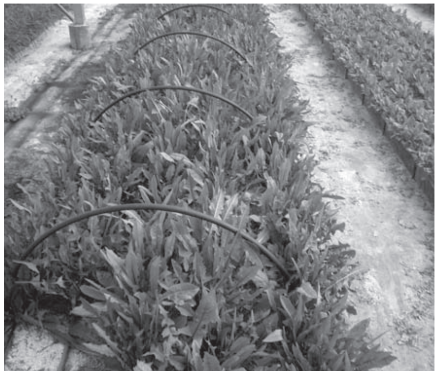
Diente de león. Muy diurético, es un gran regenerador del hígado.

–...la desobediencia. Hay que incitarla en mucha gente, porque esto provocará debate. Si a mí me han denunciado dos veces por la stevia y no se han atrevido a sancionarme, propongo a las herboristerías que hagan lo mismo. Antes me tendrían que sancionar a mí. Si desobedecemos, por los hechos consumados podemos llegar a cambiar las cosas.